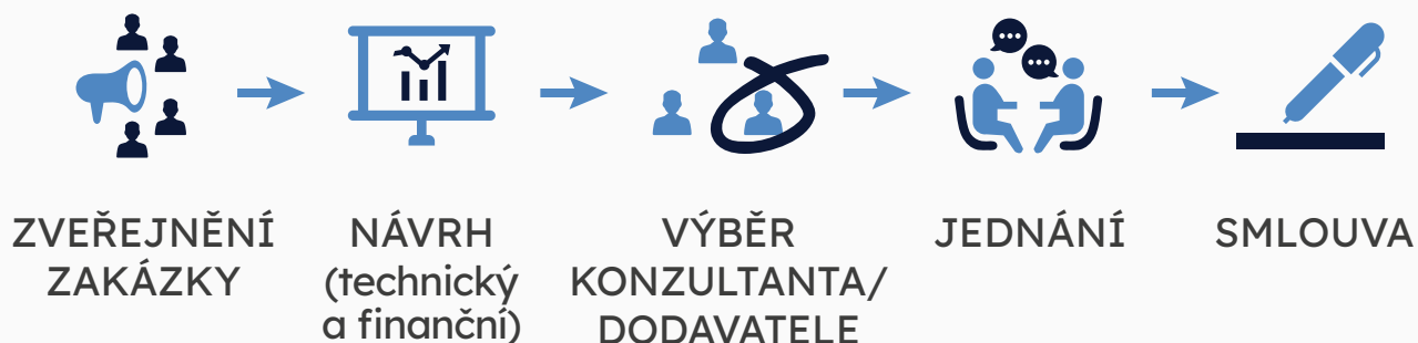
SCHÉMA DVOUSTUPŇOVÉHO VÝBĚROVÉHO ŘÍZENÍ: